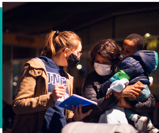
Chaque soir, place de l'Hôtel de Ville à Paris, nos équipes réfèrent les familles à la rue et les orientent vers notre réseau d'hébergeur·ses.

Mécénat : déduction de 60% du montant des dons dans la limite de 20 000 € ou 0,5 % de votre chiffre d'affaires H.T.