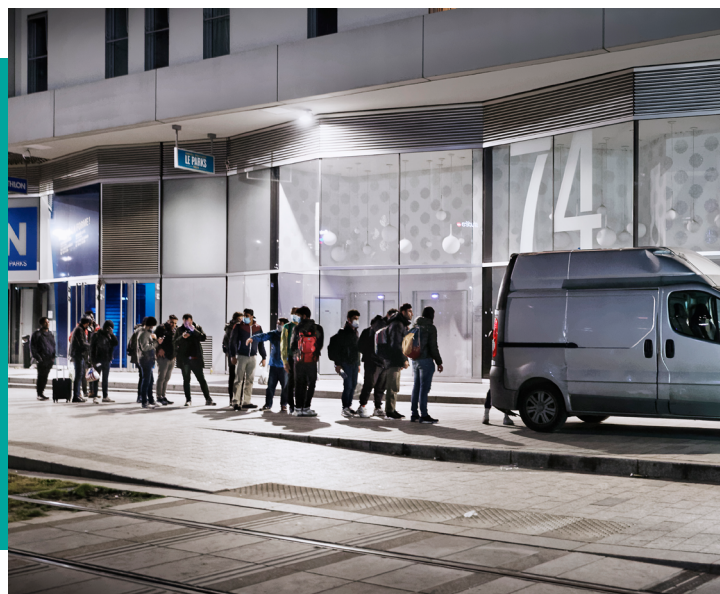
Nos bénévoles se rendent 365 nuits par an sur le terrain afin d'apporter une aide matérielle d'urgence aux personnes à la rue.